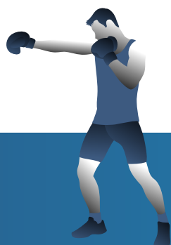
Stage en structure Action de tutorat